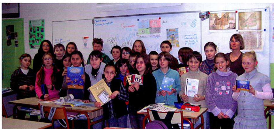
Une des classes primées au concours de l'ADPEP21