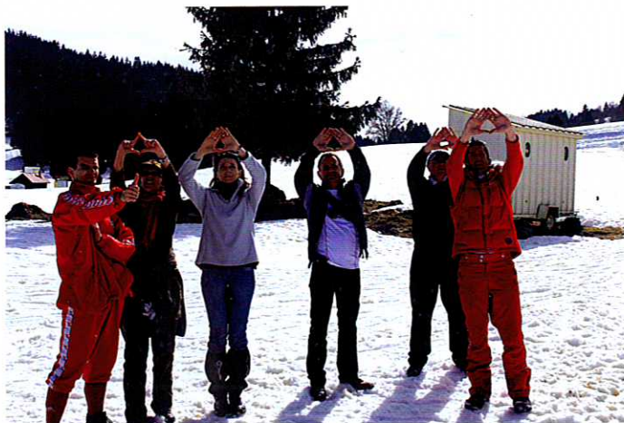
“Cadre de direction cherche œil directeur...”

A u regard des bienfaits du séminaire organisé l’an dernier, l’équipe de cadres ADPEP 21 (chefs de service, directeurs adjoints, directeurs, directeurs de pôle, direction générale) au grand complet s’est réunie à nouveau sur 2 jours, les 24-25 mars 2010 au Centre de Montagne des Jacobeys à Prémanon.